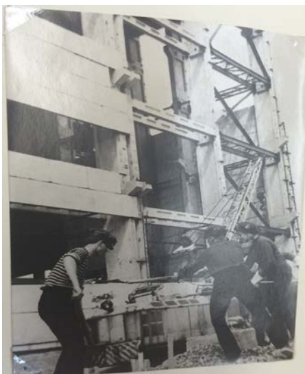
Работа старшеклассников и выпускников на стройке.